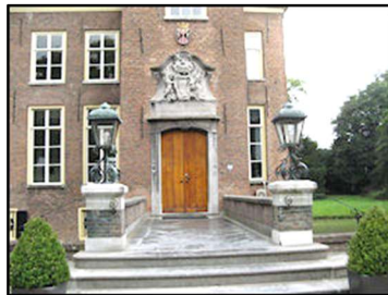
Middenrisaliet met boven de deur de wapens van Van Aylva-Van Gendt